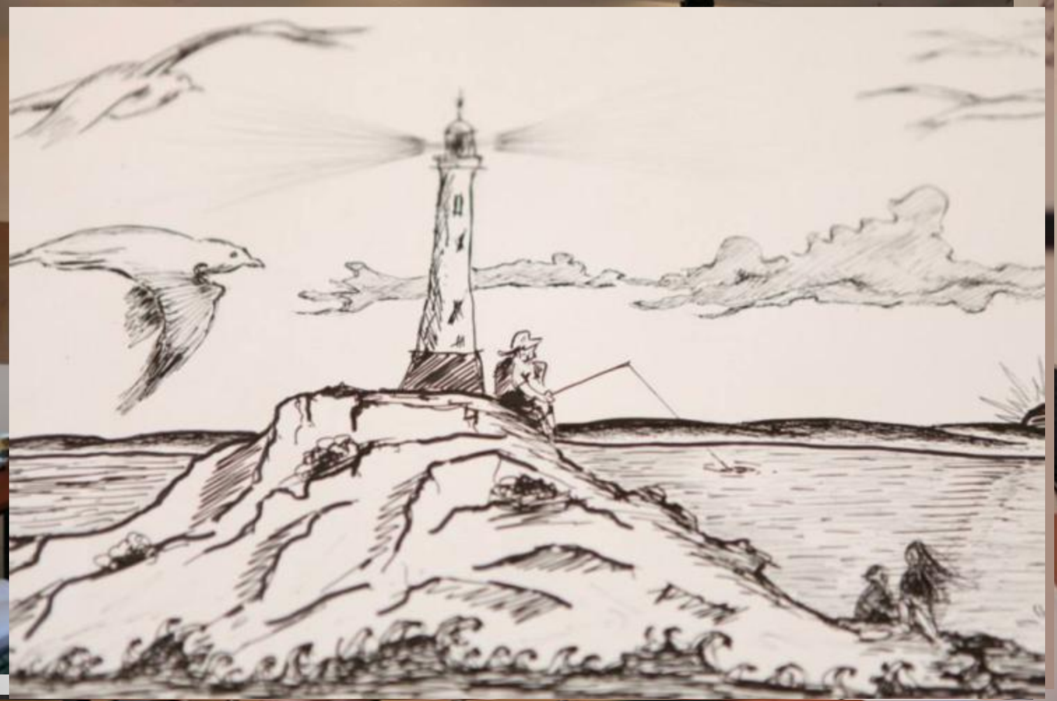
«ΝΗΣΩΝ ΠΕΡΙΠΛΟΥΣ»: Ο Πολιτισμός ως εργαλείο ανάπτυξης της Νησιωτικής Ελλάδας