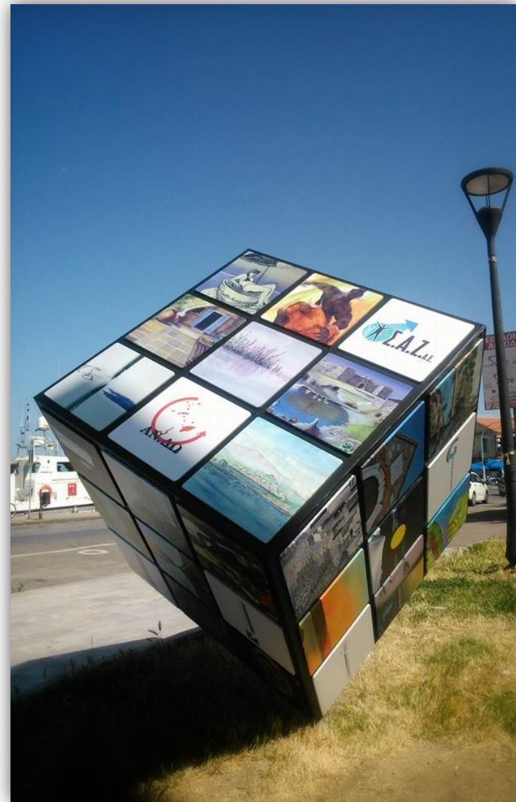
Ο κύβος με το όνομα: «ΣΥΛΛΟΓΙΚΟΤΗΤΑ»

«Νήσων Περίπλους»: Ο Πολιτισμός ως εργαλείο ανάπτυξης της Νησιωτικής Ελλάδας