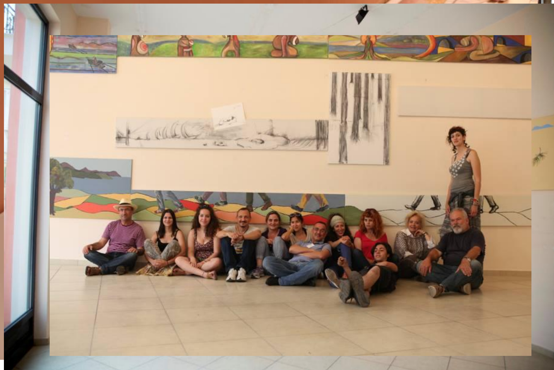
ΚΕΝΤΡΟΝ ΠΕΡΙΠΛΟΥΣ: Ο Πολιτισμός ως εργαλείο ανάπτυξης της Νησιωτικής Ελλάδας